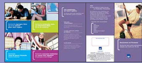
Dépliant 5 volets