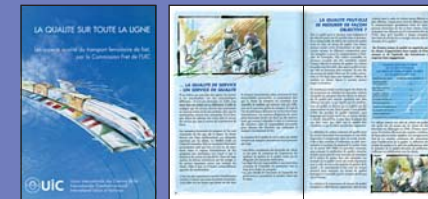
Brochure 32 pages