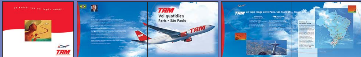
Brochure 24 pages