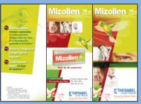
Dépliant 3 volets