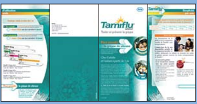
Dépliant 4 volets