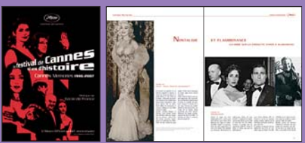
Album officiel 60° anniversaire 342 pages