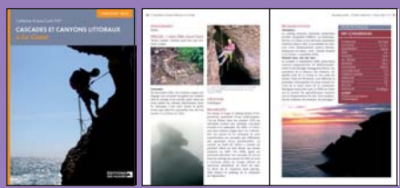
Livre 136 pages