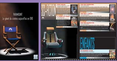
Catalogue 20 pages