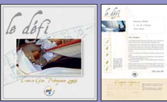
Brochure 16 pages