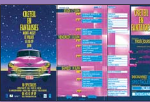
Programme 3 volets