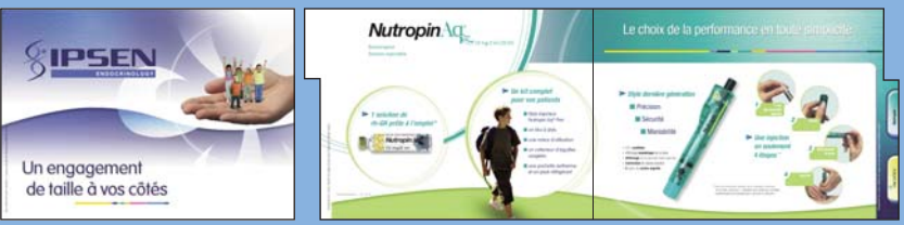
Argumentaire de vente 12 pages A4