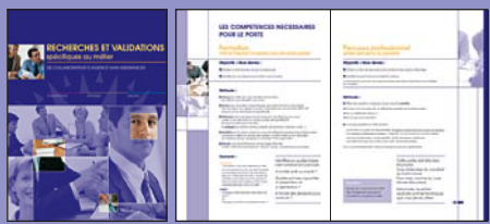
Brochure 16 pages