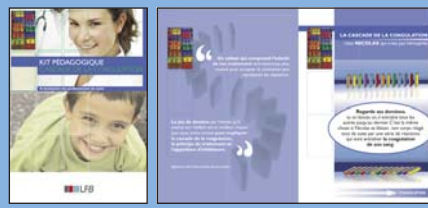
Livret 8 pages A5