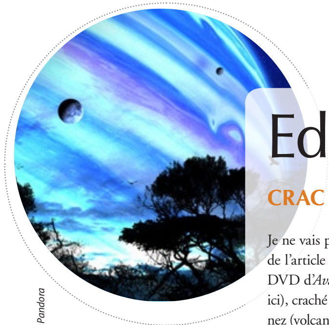
© Frey84 / Deviant Art : Pandora