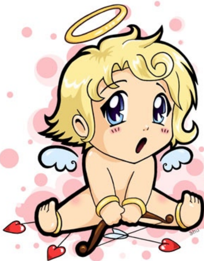
© Shushila / Deviant Art: Chibi Cupid

La transformation d' Éros en Amor change complètement la signification du symbole. Une fois retiré le pathos Éros - Thanatos , ce qui reste n'est que l'amour, pur et simple. Il y a de l'innocence dans Amor , comme si le pauvre Cupidon lui-même ne pouvait pas comprendre pourquoi exactement on en fait tout un plat. Et c'est simplement parce que nous pauvres mortels, nous sommes tellement embarrassés par l'amour pur