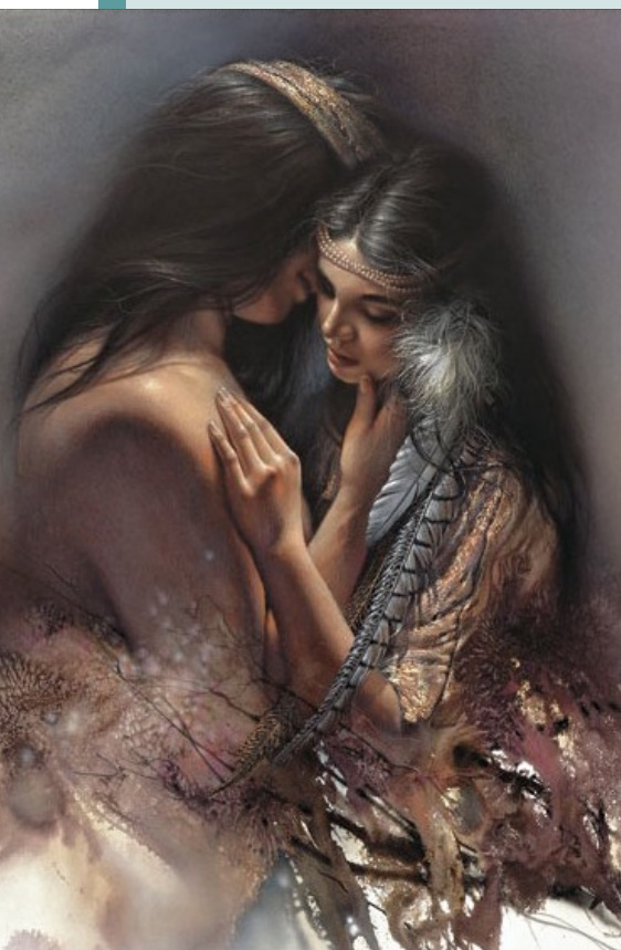
© Lee Bogle : The secret