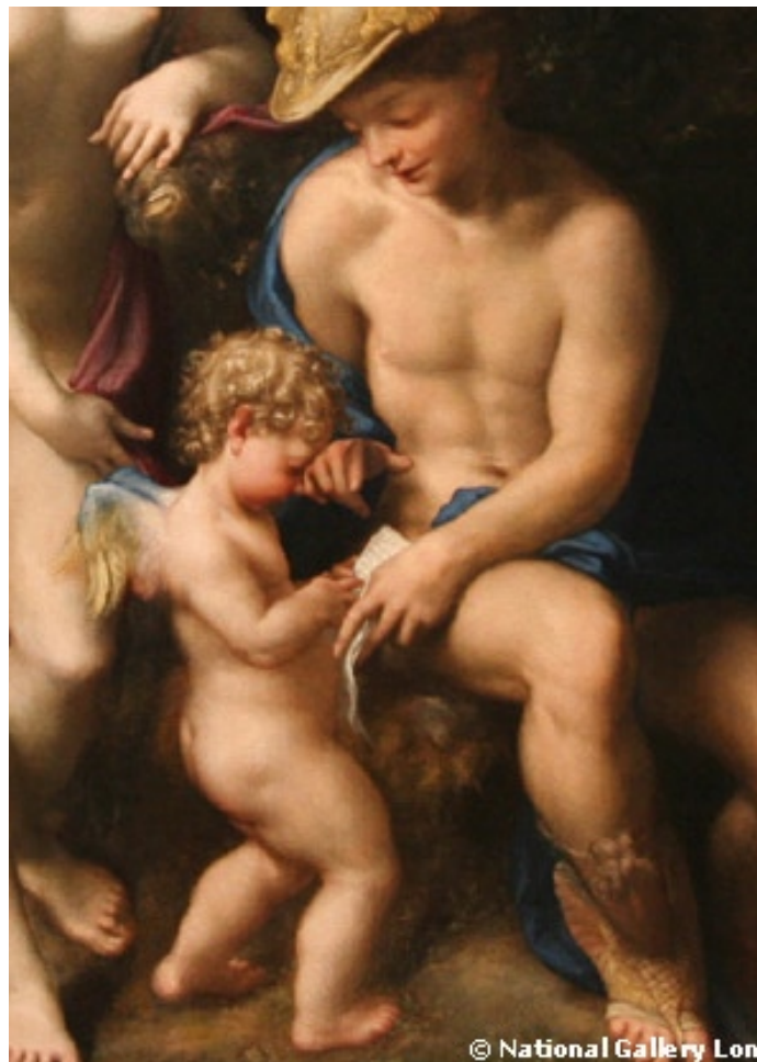
© A. Allegri / London National Gallery : Vénus Mercure et Cupidon (détail)

Lorsque nous nous ouvrons, nous prenons le risque d'être l'imbécile