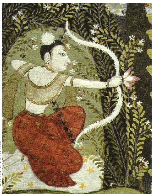
le dieu Kama

est un dieu de la fertilité. Une partie du conflit entre Éros et Psyché se produit parce qu'Aphrodite est clairement menacée par Psyché : cette outsider usurpatrice est une menace pour la relation d'Aphrodite avec Éros . Psyché représente l'affirmation d'indépendance d' Éros . Cette période de développement correspond à l'époque de la Grande Déesse et connaît une première forme sous l'aspect tripartite de la créatrice, la pourvoyeuse et la destructrice. En tant que tel, l'amour d' Éros est un amour qui reconnaît l'inévitabilité de la mort. Avec Psyché, Éros est parvenu à personnaliser l'amour. Le changement se fait depuis un lien principal de type mère-fils, à un choix d'amour. Le lien mère-fils n'a besoin d'aucun entretien du côté du fils : la mère l'aimera de toutes façons. Cet amour est impersonnel dans le sens où sa personnalité de fils n'a rien à y voir. En aimant Psyché, Éros affirme le droit de choisir qui aimer, et avec elle, il s'abandonne à sa passion.