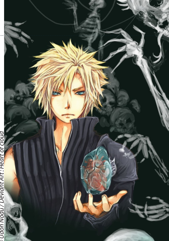
Heart of cloud

Depuis que Freud a virtuellement tout rapporté au sexe, le concept d' Éros s'est embrouillé, partiellement à cause de l'incapacité qu'il avait à