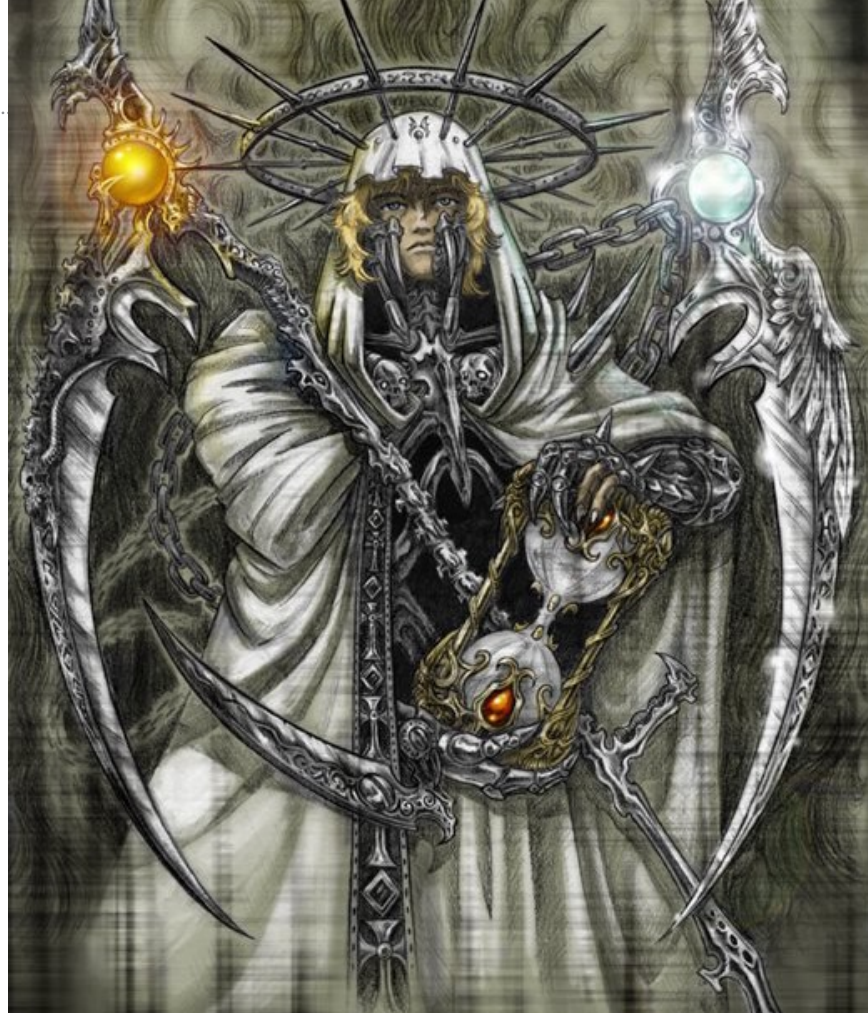
© Max Chavot / Epilogue : XII (l'arcane sans nom)

Le pouvoir est une thématique d'Éros, de sorte que nous voilà revenus à Éros-Pluton. Comme Jung le disait, « un Éros inconscient s'exprime toujours comme une volonté de pouvoir » [8]. Le sexe, la gloire, l'ar-