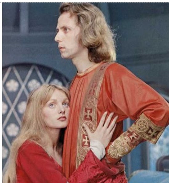
Fabrice Luchini et Arielle Dombasle dans la pièce Perceval

De bonne heure (14 ans), sous l'impulsion de sa mère et de sa Cérès dominante, Fabrice Luchini s'engage dans un apprentissage de coiffure : un emploi pratique et concret le mettant directement en relation avec le monde du travail (énergie cérésienne). Ainsi, nous pourrions supposer que sa LN Gémeaux lui ait coupé l'herbe sous le pied en l'empêchant de continuer ses études (et nous pouvons y ajouter une connotation karmique, pour ceux qui y croient).